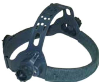
SOPORTE PARA CARETAS 9-13