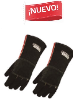
PAR DE GUANTES IZQUIERDOS 14" INTERMEDIO