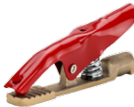
PINZA DE TIERRA 300A FUNDICIÓN BRONCE