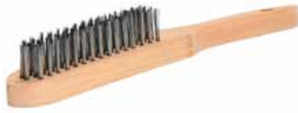
CEPILLO DE ALAMBRE ACERO INOXIDABLE (4X16")

CEPILLO DE ALAMBRE ACERO AL CARBON (4X16")