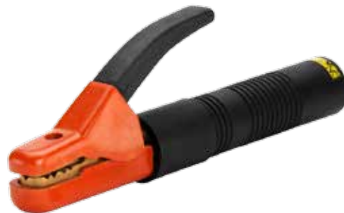
PINZA PORTAELECTRODO USO RUDO 300A/500A