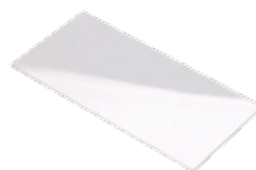
MICA INT. CLARA POLICARB. (110x52MM)