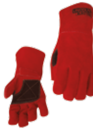
GUANTE PARA SOLDAR KEVLAR® 14" USO RUDO