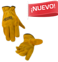
GUANTE ARGONERO CARNAZA