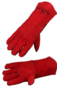
GUANTE ROJO PARA SOLDADOR 14"