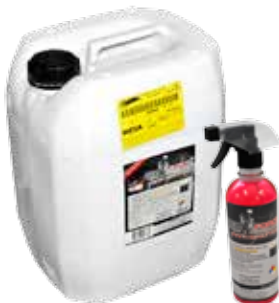
ANTICHISPA 20LTS RED FORCE® + 5 ATOM