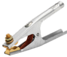
PINZA DE TIERRA PROFESIONAL 500A