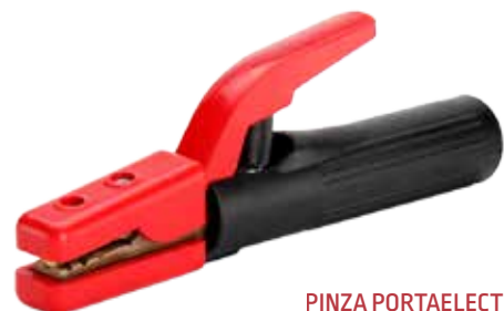
PINZA PORTAELECTRODO USO INDUSTRIAL 250A/300A/500A