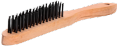
CEPILLO DE ALAMBRE ACERO AL CARBON (4X16")