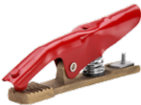
PINZA DE TIERRA 250A FUNDICIÓN BRONCE