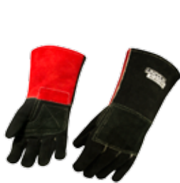
GUANTE PARA SOLDAR KEVLAR® 14" INTERMEDIO