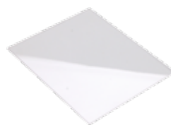
MICA EXT. PARA CARETA DE SOLDAR 9-13 (116 X 95 MM).