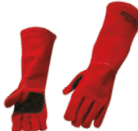
GUANTE PARA SOLDAR KEVLAR® 18" USO RUDO