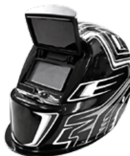
FLIP UP BLACK METAL