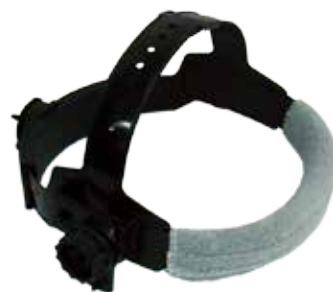
SOPORTE PARA CARETAS

MICA INT. PARA CARETA DE SOLDAR (97 X 47 MM) 9-13