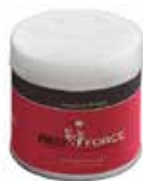
ANTICHISPA GEL 300grs