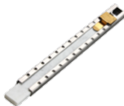
TIZA CON PORTATIZA