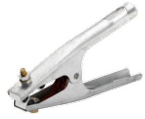
PINZA DE TIERRA PROFESIONAL 300A